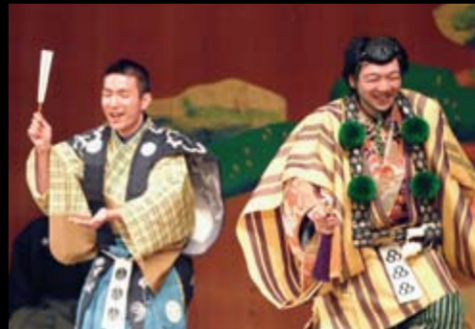
狂言「蝸牛」午後1:00～ 茂山狂言会